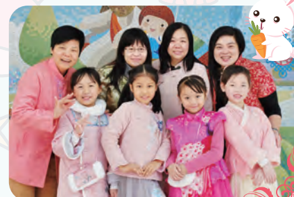
穿上華服的女同學格外可愛