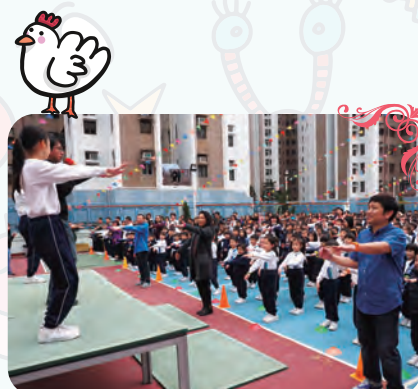
千人體適能活力舞