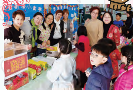
家長義工的小食攤位甚受歡迎