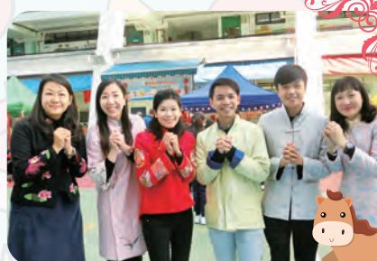
老師們都穿上華服