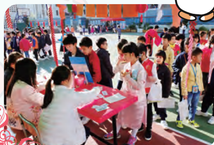
同學們排隊玩攤位遊戲