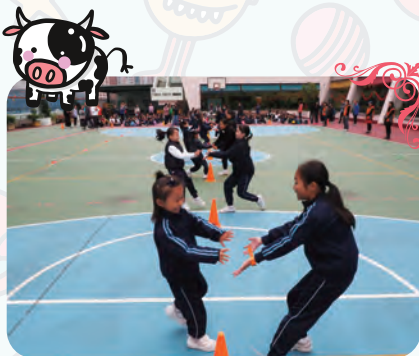
一、六年級進行「沿途有妳來回耐力跑」

本年度體育科在遊戲日舉辦名為「千人齊做體適能」遊戲日。活動內容包括來回耐力跑、井字過三關、仰臥起坐及千人體適能活力舞四個項目。學校希望透過體適能的活動，培養學生互助友愛的精神，並促進學生的身心靈健康的發展。