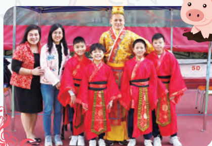
黃老師的皇帝扮相最為矚目

中文科於1月25日舉行「中國文化嘉年華」。當天學生及老師均投入活動，大家更穿上華服，增添活動的氣氛。