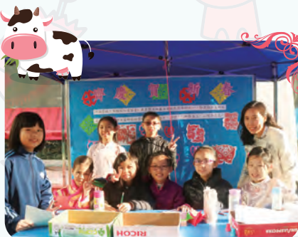
攤位具有中國文化特色