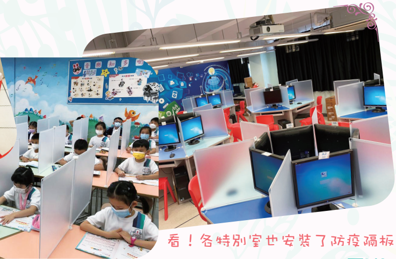
看！各特別室也安裝了防疫隔板。