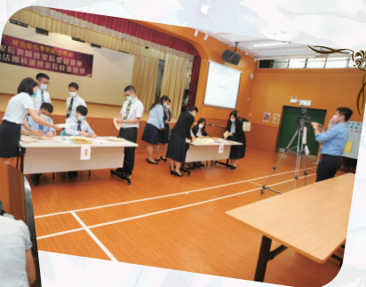
謝校長及邱主席監察點票過程，學生、家長可經直播觀看。