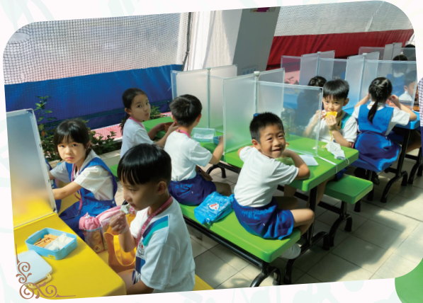
彩虹枱設置防疫小屏風，大家可以安心吃東西和談天了。

近來疫症肆虐，為了打造一個清潔衛生的校園環境，本校花了不少心思在防疫措施上，以保障所有同學的健康。在音樂室、電腦室裏，校方在書桌上安裝了防疫隔板，讓學生在安全距離下上課；在圖書館內，校方特意添置圖書消毒機，讓學生放心閱讀；在課室、彩虹枱更設置防疫小屏風，讓學生安心在小息時進食。希望以上設施，能令學生在疫情中安心地享受校園生活！