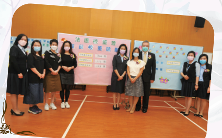
網上周年大會及選舉點票順利完成