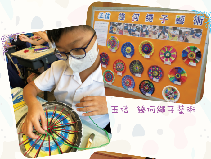
五信 幾何繩子藝術