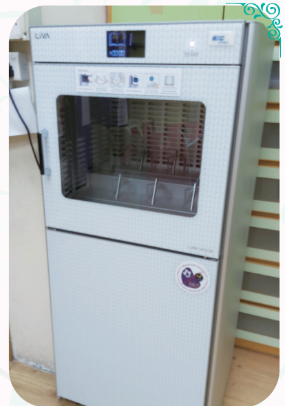
圖書館增添了一部圖書消毒機，無論是借出或歸還的圖書也要它幫忙消毒啊！