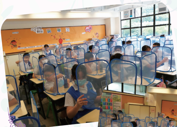
小息時間，同學們都自律地為自己的書桌上加上防疫小屏風。