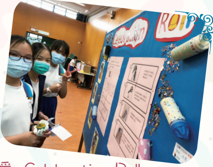
六愛 Celebration Roll