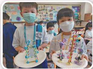
二年級同學設計及製作安全屋