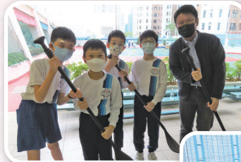
四至六年級同學還體驗了直立板之水池划漿