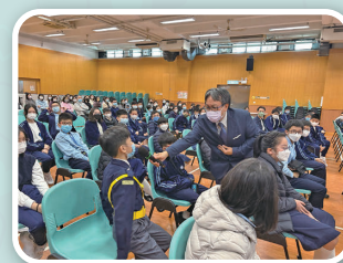
同學積極提問，希望可以掌握更多實用的升中面試資訊。