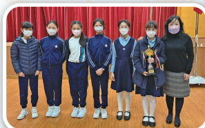
女子甲組團體第二名