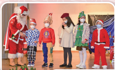
聖誕老人魔術表演及派禮物給各班同學

自十二月以來，大家都熱切期待預許的默西亞——主耶穌在聖誕節來到人間，教導我們順從真理，實踐仁愛。我們希望所有人都獲得天主賞賜的喜樂與平安。本校於12月21日舉行聖誕祈禱會，透過聖誕話劇重溫耶穌降生的事蹟，學生們以聖詠回應天使發出的邀請，願意於聖誕佳節把喜樂和平安帶給身旁的人。