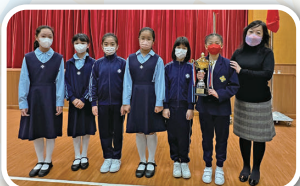
女子乙組團體第二名