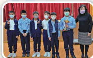
男子乙組團體第二名