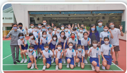
出發比賽前，校監及校長為運動員打氣!