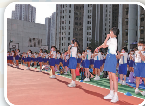
大家先做熱身，再比拼