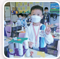
一年級同學設計及製作小熊的床