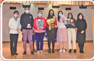
同學和老師也有份的聖誕大抽獎