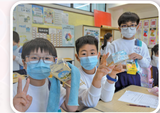
三年級同學設計及製作橡筋動力船