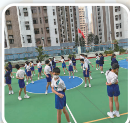
運動員比賽前熱身