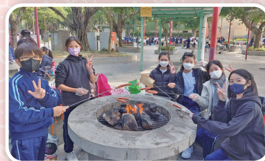
一、二年級旅行地點:大埔海濱公園