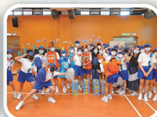
啦啦隊比賽，真精彩