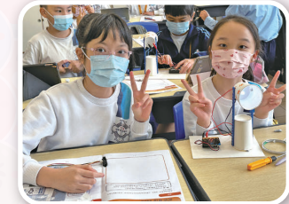
五年級同學製作智能燈