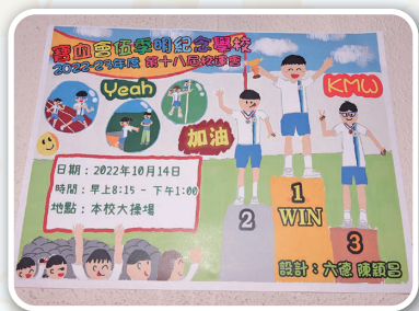
第十八屆校運會海報

因為受疫情影響的關係，本屆的校運會仍未能到運動場舉行，只能在校內進行。運動會當天，在鍾校長啟動傳聖火儀式後，4-6年級學生參加的運動會便正式開始。運動會項目多元化，除了跑步比賽，擲豆袋比賽、跳遠比賽外，還有精彩的啦啦隊比賽。讓我們一同看看當天盛況！