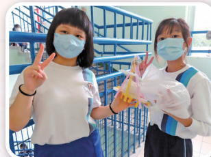
四年級同學化身成為雞蛋拯救隊