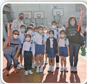
寶季全運會開幕儀式 (火炬傳遞)