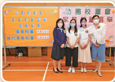
鍾校長、胡女士、何女士和湯主席一同合照