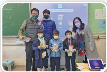
同學們用平板電腦進行英語問答比賽，氣氛緊張刺激