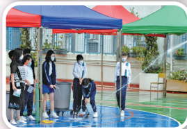
六年級同學製作水火箭